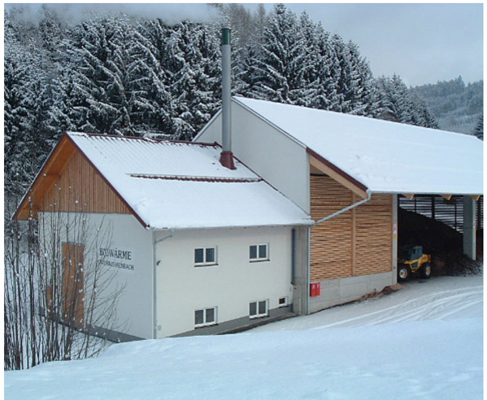
Die Zentrale beliefert die Wärmekunden rund um die Uhr mit wohliger Wärme, für die Abnehmer bedeutet dies hohen Komfort bei minimalem Aufwand.

Unter dem hydraulischen Abgleich einer Heizungsanlage versteht man die Vornahme von Einstellungen, damit jeder Raum so viel Wärme bekommt, wie er braucht und somit das System