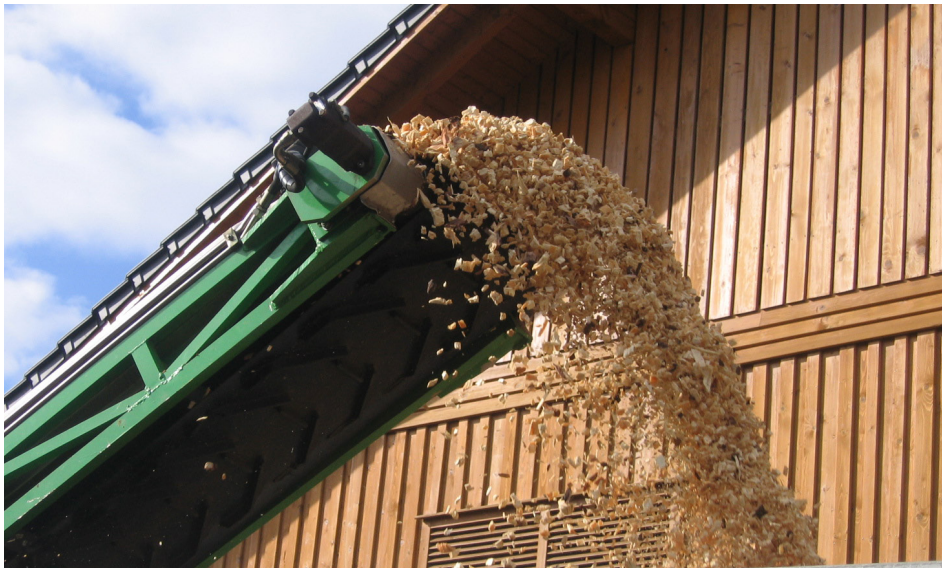
Brennstoff für Biowärme-Anlagen sind Hackschnitzel aus der Region, ein Schüttraummeter Hackgut ersetzt rund 76 Liter Heizöl.