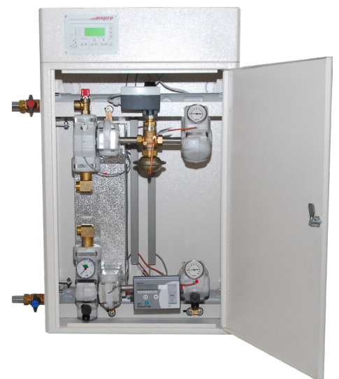
Übergabestation mit integriertem Wärmemengenzähler; der Platzbedarf für eine solche Station ist äußerst gering.

Die Übergabestation ist dabei nicht größer als ein Sicherungskasten und findet überall problemlos Platz. Auch die Kosten sind übersichtlich: Sie zahlen nur die tatsächlich konsumierte Wärme – die Menge wird direkt an der Übergabestation gemessen und transparent abgerechnet.