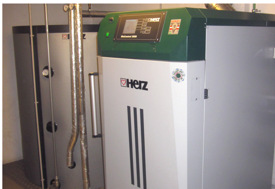
Ein Pufferspeicher ist beim Scheitholzkessel empfehlenswert, da er die Wärme kontinuierlich an das Heizsystem abgibt.