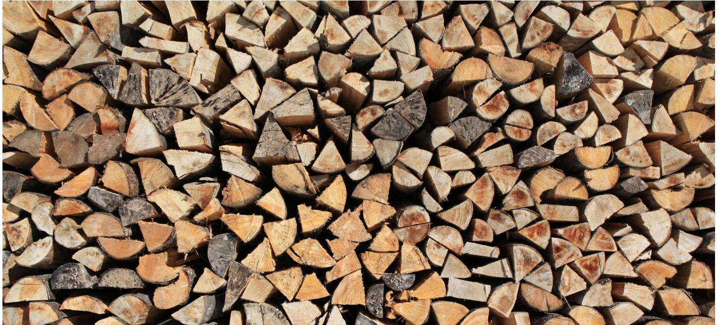
Scheitholz ist in Österreich das beliebteste Heizmaterial.

Scheitholz ist der Klassiker unter den Holzbrennstoffen. Besonders gut geeignet ist es für alle, die über eigenen Wald oder eine andere günstige Bezugsquelle verfügen. In diesen Fällen ist das Heizen mit Brennholz unschlagbar preiswert.