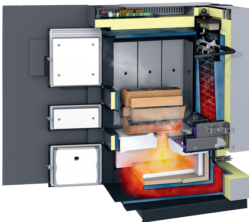
Eine große Füllraumtür, guter Zugang zum Anzünden und eine Ascheentnahme vollständig von vorn erleichtern die Bedienung einer modernen Scheitholzzentralheizung.

nungsstationen vorgesehen ist oder wenn die thermische Sanierung erst später umgesetzt werden soll. Zudem kann der Pufferspeicher die Lebenserwartung des Kessels erhöhen und Emissionen reduzieren. Die Kombination Biomasseheizung und Solaranlage macht die Heizungsanlage noch effizienter. Die Solaranlage übernimmt im Sommer und in der Übergangszeit die Warmwasserversorgung und hilft so,