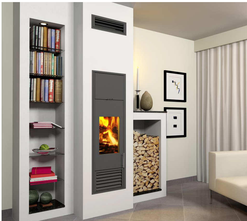
Moderne Stückholzöfen sorgen für behagliche Wärme in der Wohnung – auch bei Stromausfall oder Lieferengpässen mit fossilen Brennstoffen.

Ob Werkstatt- oder Kaminofen, Tischherd mit Backrohr bis hin zur raumluftunabhängigen Ganzhausheizung – moderne Holzöfen verbreiten Behaglichkeit und machen unabhängig von Energielieferanten. Dazu spart man noch einen guten Teil Heizkosten.